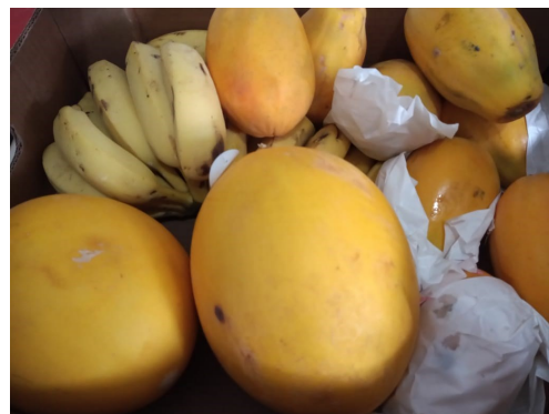
Doação Edu Cruz

Nossa imensa gratidão às doações e trabalho voluntário realizados em Abril