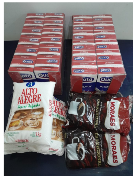
Doação Cláudia Panullo