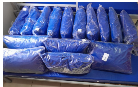
Este mês realizamos a troca dos travesseiros

Nossa imensa gratidão às doações e trabalho voluntário realizados em Outubro