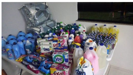
A Primeira Igreja Batista em Amparo fez uma doação de produtos de limpeza no valor estimado de R$ 1.950,00

Pedimos ao Senhor que abençoe cada um neste precioso trabalho, que sejam benção no desenvolvimento da Casa de Apoio e que sejam fortalecidos nas suas ações e direcionados pelo Senhor em decisões.