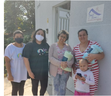
Visita da Ong Fios do Bem, de Piracicaba

Nossa imensa gratidão às doações e trabalho voluntário realizados em Junho.