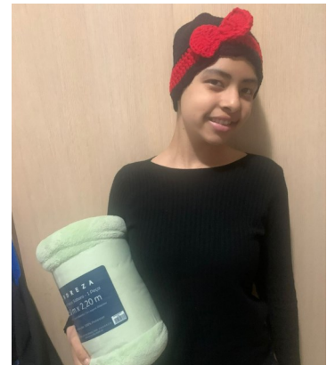
Doação da fios do bem - toucas e mantas