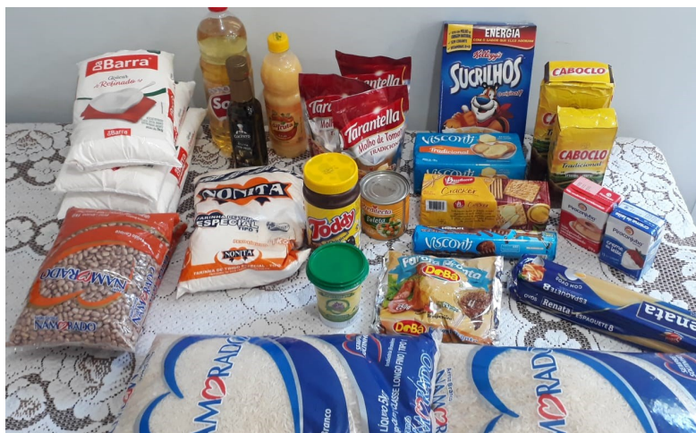
Doação de alimentos