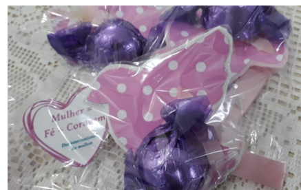
Trufas Dia da Mulher