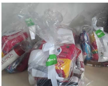
Kit feminino Dia da Mulher