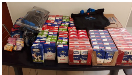
1ª Igreja batista em Amparo