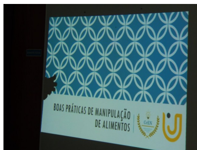
Grupo de Estudos em Nutrição (GrEN) da UniFAJ