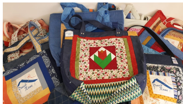
Sacolas em patchwork—IPJG