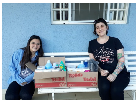
Produtos de limpeza doados pela Igreja Batista Memorial do Centenário